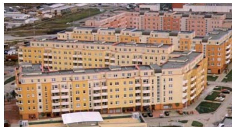
Byty, byty, byty. Developerské firmy staví jako o život, ale trh je nyní zcela přesycený.

jiní se chovají jako kamikadze, když zarputilou obhajobou neobhajitelné-